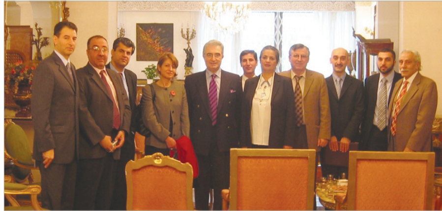
السفير الشيشلي مع ممثلي منظمات الجالية العراقية في المملكة المتحدة

والشبيبة العراقيين في م.م. هيئة مساندة كركوك. اتحاد الكتاب والصحفيين العراقيين في م.م. منظمة الشباب العراقي المتحد. المنتدى العراقي في الشمال الشرقي. جمعية الاسكان الكوردية.