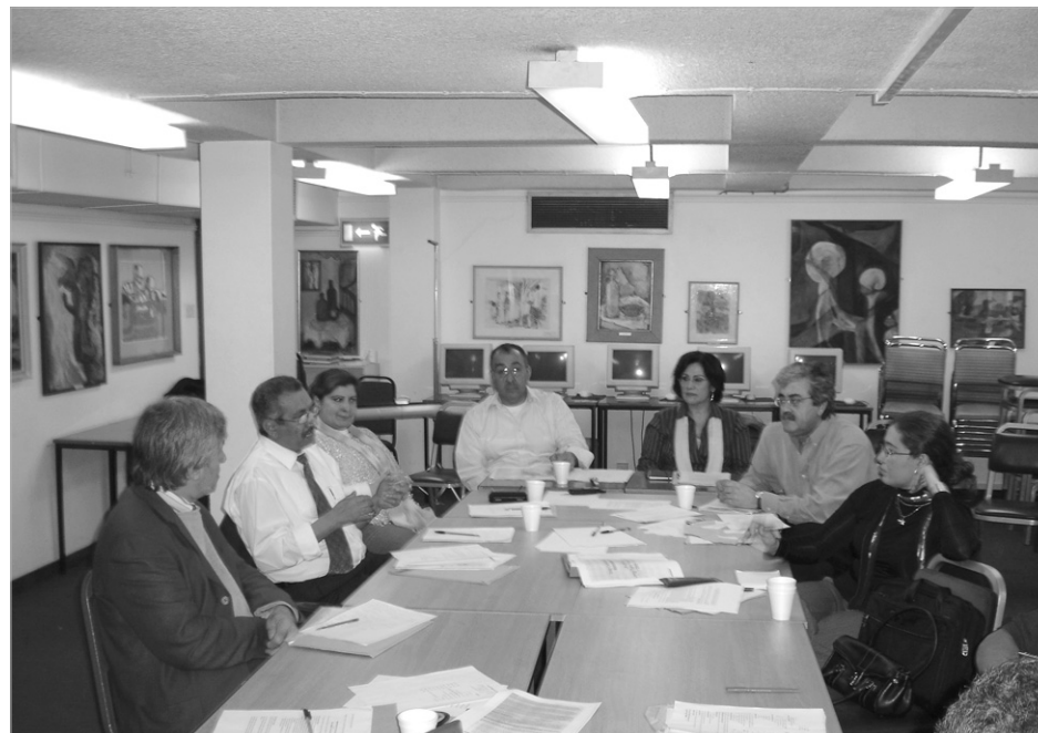
صورة من يوم العمل