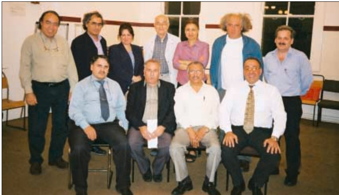
بعض الحاضرين في الاجتماع المشترك للهيئة الادارية والاستشارية وموظفي المنتدى

لا يزال المنتدى محط اتصال العشرات من ممثلي وسائل الاعلام المحلية والوطنية البريطانية وكذلك العالمية، ورغم ما أنجزه فان هناك الكثير من الآمال والطموحات والمشاريع التي تحتاج إلى العمل والمثابرة على تحقيقها، وربما تأتي في مقدمة ذلك الحاجة إلى مركز ومقر ثابت لاجاليتها.