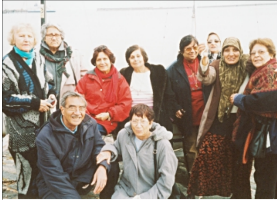
سفرة نادي كبار السن الى نيورومن

١ - تنظيم اللقاءات النسوية الصحية الأسبوعية أيام الخميس والتي كان عددها ٤٢ لقاء . معدل الحضور فيه كان ٢٦