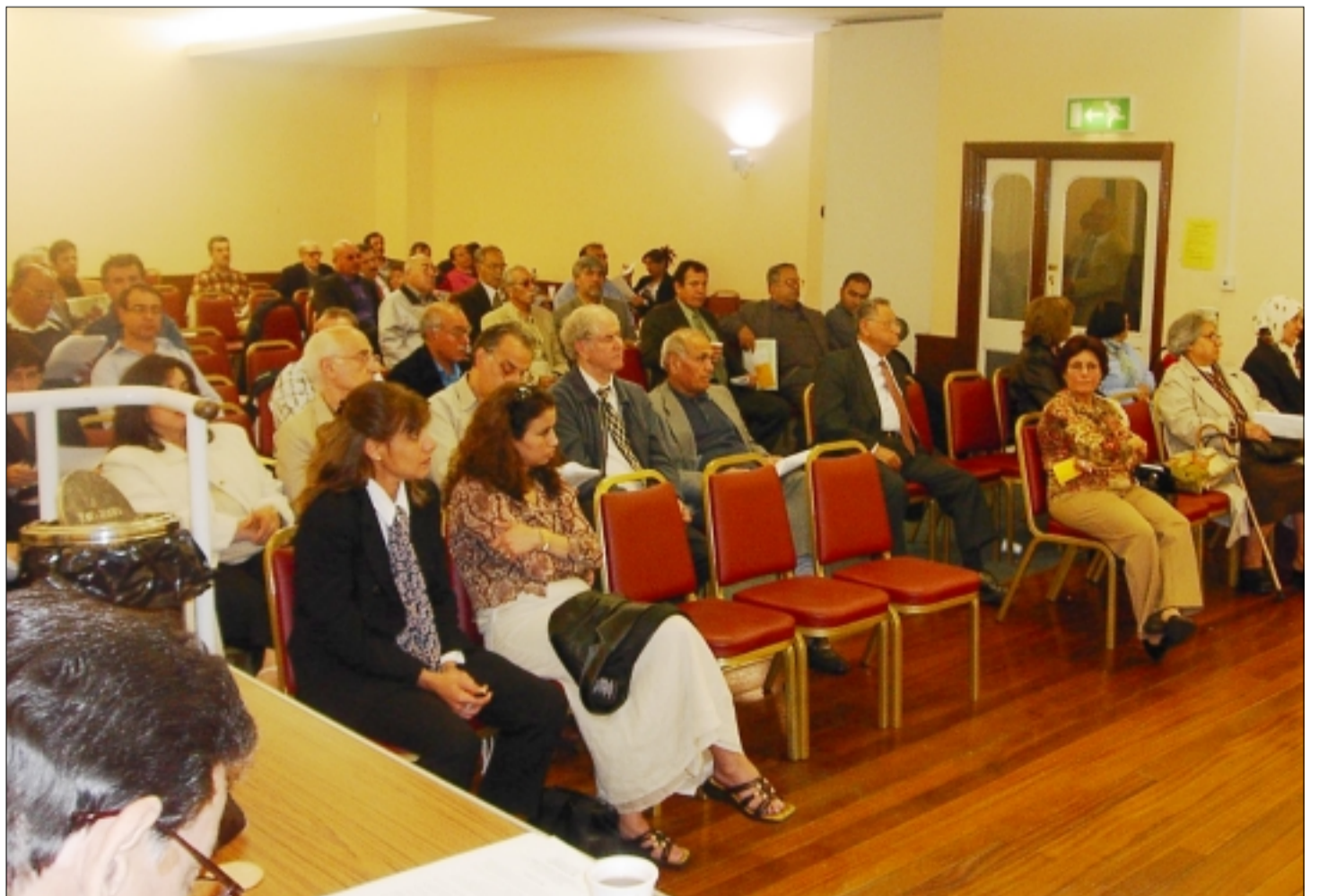
المؤتمر السادس عشر