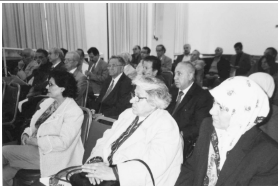
جانب من المؤتمر

يحتل هذا النادي مكانة متميزة بين كبار السن من الجالية العراقية نظرا لموقعه