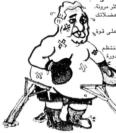
بقلم الدكتورة شذى جعفر