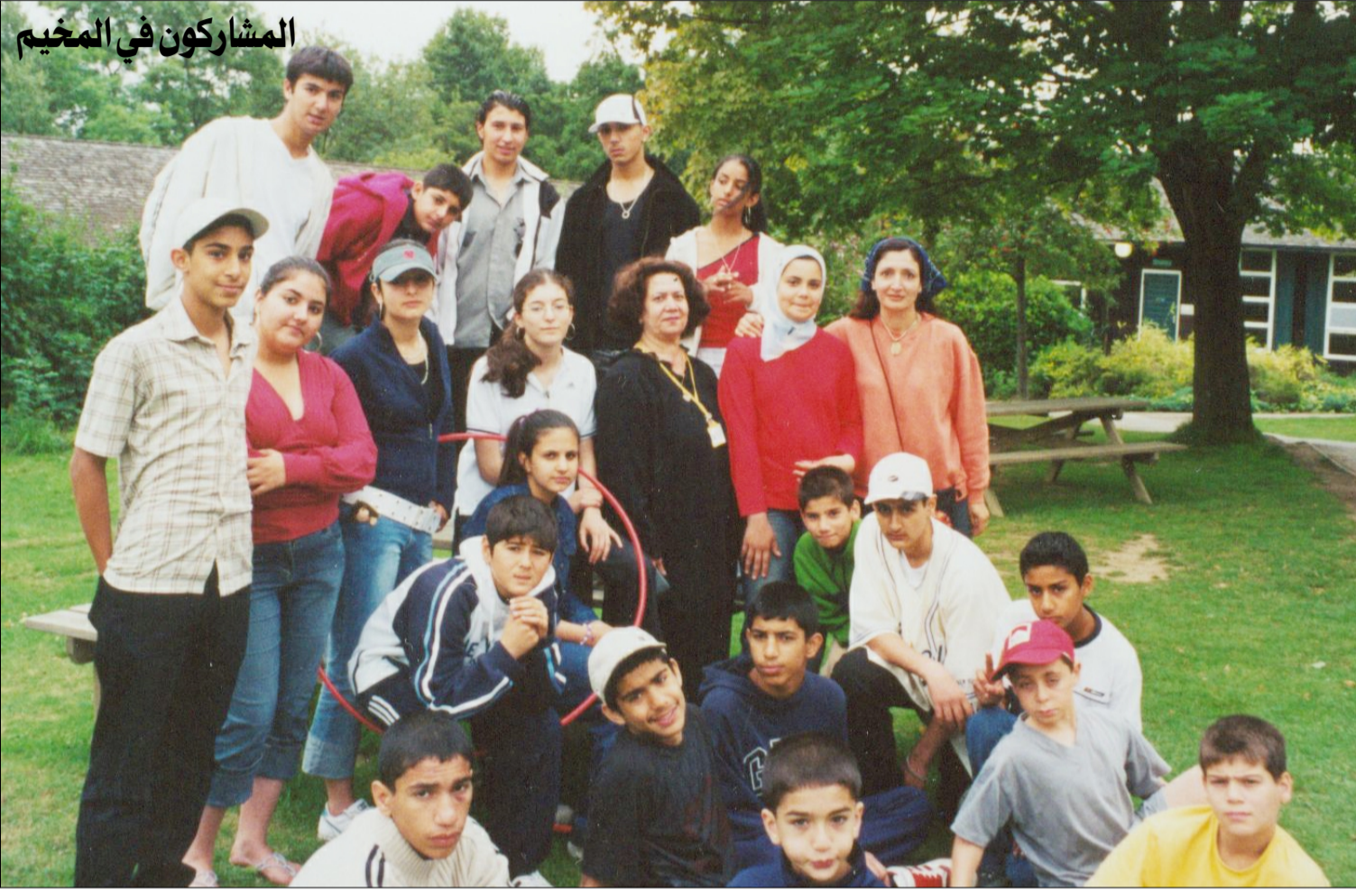
المشاركون في المخيم

ضمن فعاليات قسم الاطفال والشباب، اقيم المخيم الصيفي السنوي للمنتدى في مركز Sayer Croft الواقع في منطقة Surrey للفترة من ٧/٢٨ ولغاية ٨/١ وخصص المخيم لليافعين باعمار ١٠ - ١٥ سنة. وعلى مدى خمسة ايام من التواجد والعيش في الغابة، قضى المشاركون في المخيم اوقاتا جميلة واقامت العديد من الفعاليات والنشاطات منها: الصعود والتسلق، المشي على الحبال، السير في طرق الغابة، السباحة، رمي القوس، عمل الزوارق والملاجيء من الخشب، اشعال النيران وعمل المشويات مساءً، ألعاب رياضية متنوعة، وغيرها من النشاطات.