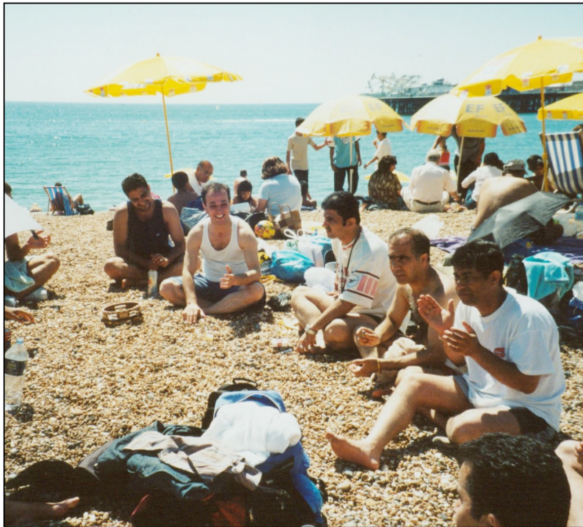
ICA Annual Trip to Brighton

Five days in the camp seems to the children very little time to be spent in the nature, they hope next year it will be longer.