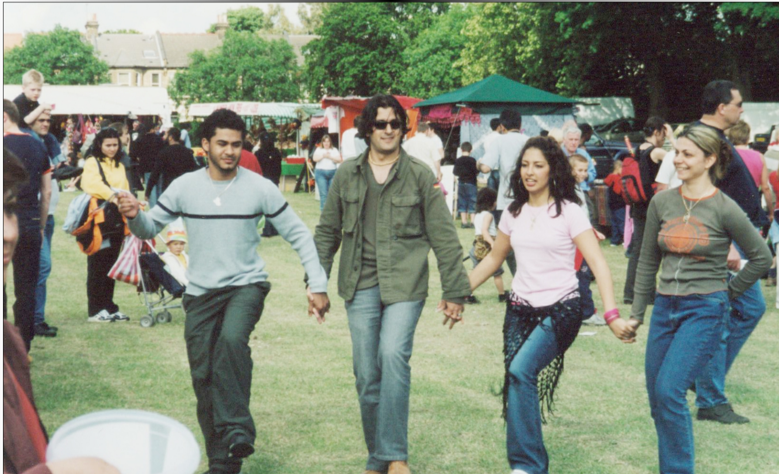
الشباب يشارك في نشاطات المنتدى

ويتدخل الطبيب كمال ليقول ان مثال وائل يمكن اعتباره