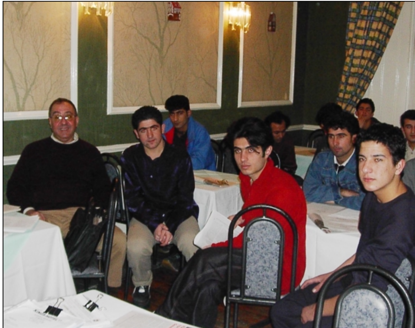
المنتدى العراقي يقوم بزيارة اللاجئين العراقيين القادمين من معسكر «سانغيت» في فندق Kings Hotel

ومركز الشؤون القانونية او مركز الخدمات الاجتماعية او جالية اللاجئين لطلب المساعدة.