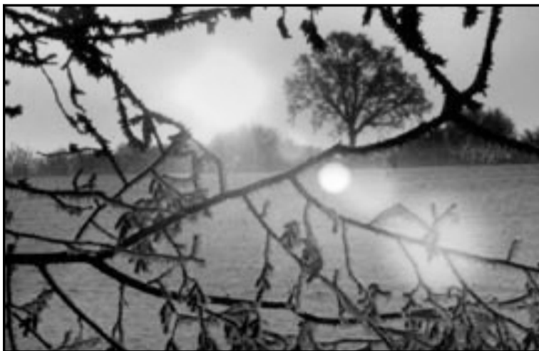
انعدام ضوء الشمس يسبب الاكتئاب لبعض الناس

وقال ريتشارد بروك، مدير جمعية الصحة النفسية والعقلية: «إن ضغوط أعياد الميلاد والاستعداد لها بالإضافة إلى أيام الشتاء القصيرة والباردة والمظلمة - كل ذلك يسبب إهمال صحتنا العقلية أثناء هذه الفترة».