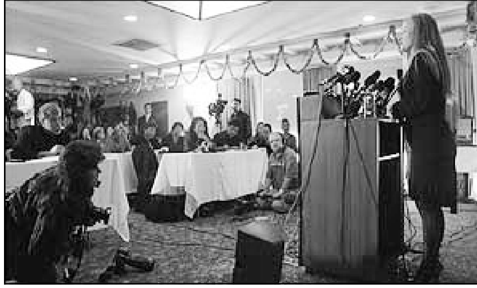
كلونايد هي الشركة التي تبنت حالتها الاستنساخ الوحيدتين

والذي الطفلة، اللذان خشياً من أن تكشف الاختبارات عن هويتهما أو تستخدم كذريعة لنزع الطفل من رعايتهما.