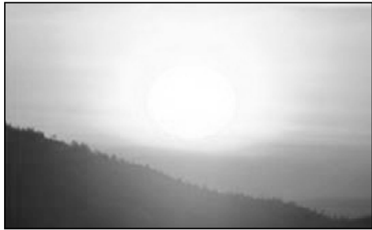
أشعة الشمس ستستغل في توليد الطاقة الكهربائية

يمتد لسبعة كيلومترات (٤.٣ ميل). وستقوم الشمس بتسخين الهواء تحت السقف الزجاجي، وسيثير أثناء ارتفاعه تياراً هوائياً إلى الأعلى في داخل البرج، مما يتيح أمر امتصاص الهواء عبر ٣٢ تربيعة. وستدور التربينات بعد ذلك، مما سيولد طاقة كهربائية على مدار الأربع والعشرين ساعة في اليوم.