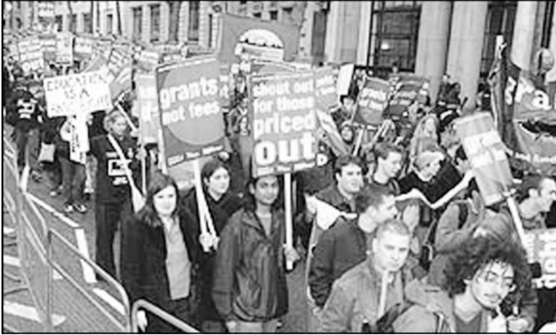
تظاهرة احتجاجية على ارتفاع اجور الدراسة في بريطانيا

توقع وزير التربية البريطاني تشارلس كلارك أن تصل الديون المترتبة على الطلاب عند انتهاء تعليمهم الجامعي إلى ما بين ١٨ ألف و٢١ ألف جنيه استرليني.